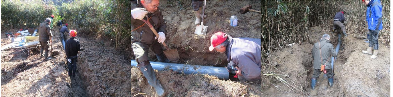
Eサイト南側パイプ埋設

作業：第4サイトEサイトの暗渠とパイプ埋設及びサイト内整地 Eサイト前水路製作と川下の掘削