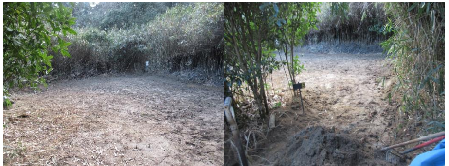
施工後、整地されたEサイト