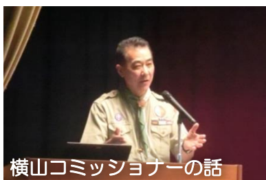
横山コミッショナーの話