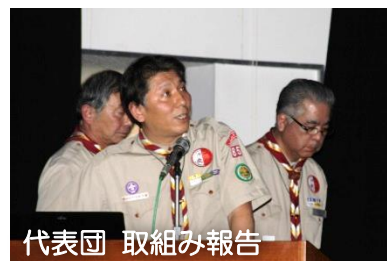
代表団 取組み報告