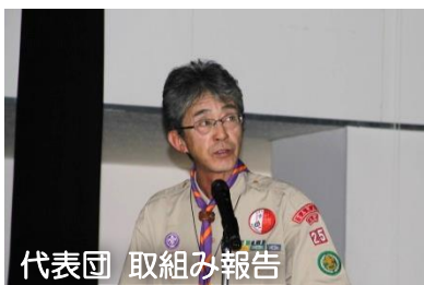
代表団 取組み報告