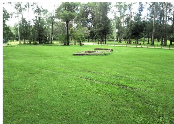
BPパークキャンプ場のファイアベース