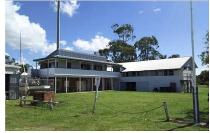
↑ (ブラウンシー水上活動センター)

大阪出発：3月22日 夕刻・関西国際空港出発 3月23日 午後・ブリスベン国際空港到着 帰国：4月1日 早朝・ブリスベン国際空港出発 同日 夕刻・関西国際空港到着 詳細は以下の通りである。