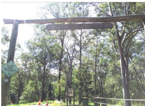
タイムラムキャンプ場のゲート